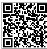
QR Code Produk

Diterbitkan di Jakarta, 8 April 2026 KEPALA BADAN STANDARDISASI DAN KEBIJAKAN JASA INDUSTRI